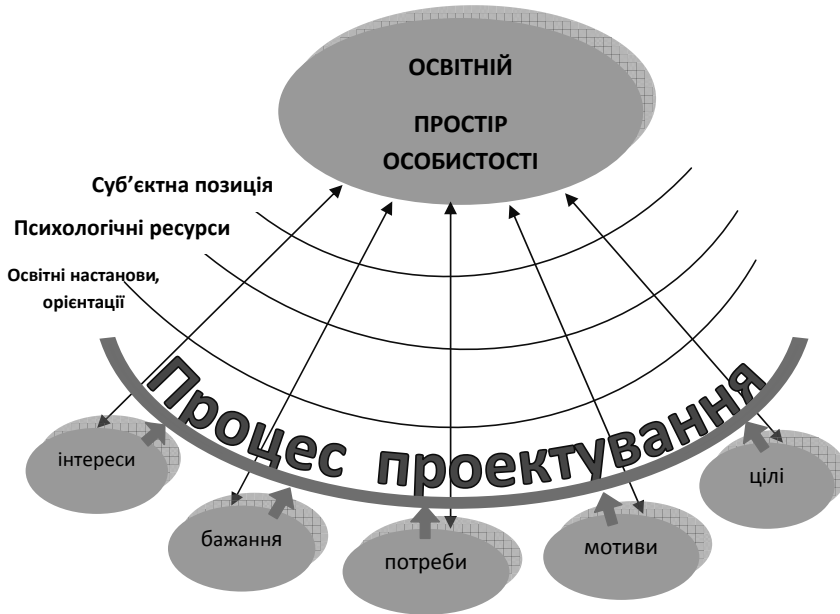
Рис.1. Проектування освітнього простору особистості

Зважаючи на ці напрями розвитку проектної парадигми в освіті, ми розробили психолого-педагогічну технологію проектування освітнього простору особистості, в якій виділяємо три блоки: блок психолого-педагогічних, організаційно-діяльнісних та індивідуально-психологічних компонентів проектування освітнього простору. До блоку психолого-педагогічних компонентів проектування освітнього простору ми включили концептуальні засади побудови об'єкта (прогностичної модельної уяви), цілепокладання – формування цільових настанов (мети, змісту, ідей у межах освітніх систем цінностей і потреб), завдання проектування та опис бажаних результатів у цій моделі (див. рис. 2). Продукт, отриманий на цьому етапі, має універсальний характер і може слугувати методологічною основою для створення аналогічних продуктів різних рівнів проектування освітнього простору. Далі ми вважали за доцільне визначити стадії проектування прогнозування, розроблення, комбінування ідей та ухвалення рішень щодо реалізації проекту, який здійснюється завдяки системі запланованих дій, моделюванню, технологічному забезпеченню, що становить основу блоку організаційно-діяльнісних компонентів проектування. Призначення діяльнісних компонентів пов'язане з організацією діяльності безпосередньо самих студентів, які здійснюють проектування освітнього простору.