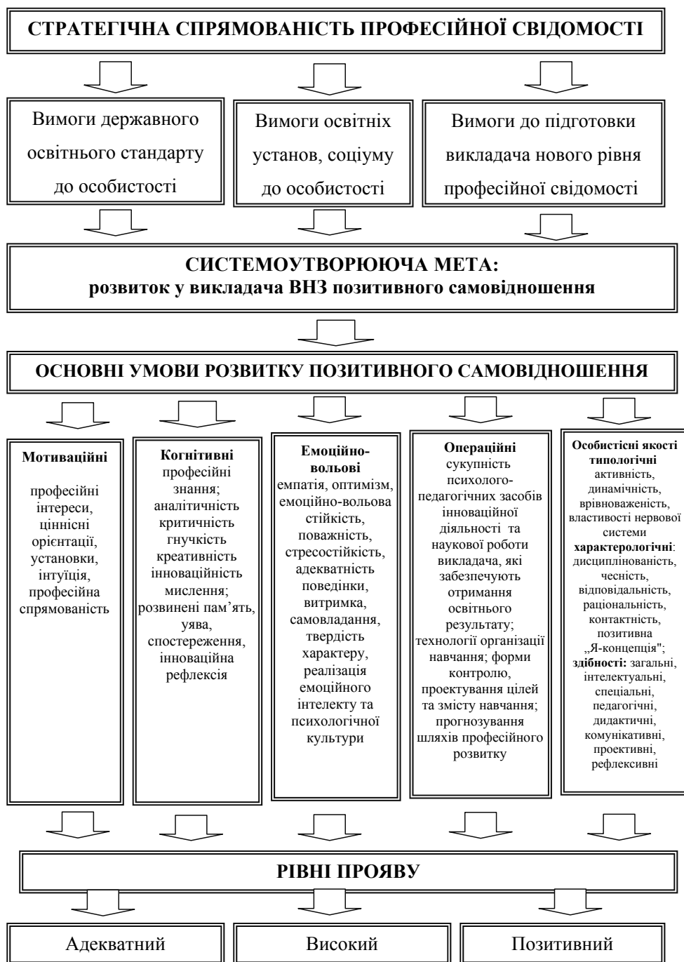
Рис. 2. Модель розвитку позитивного самовідношення у викладача ВНЗ