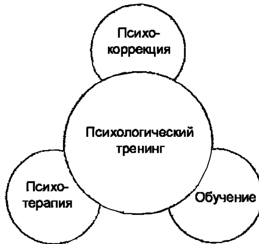
Мал. 1. Співвідношення понять «психотерапія», «психокорекція» і «навчання» (Вачков І. В., 1999, с.13)

Розглядаючи тренінг в рамках діяльності з розвитку особистості, важливим, на наш погляд, є взаємозв'язок різноманітних форм групової психологічної роботи, що межують з навчанням, терапією і корекцією [3]. Найбільш наочно це відображено на малюнку 1.