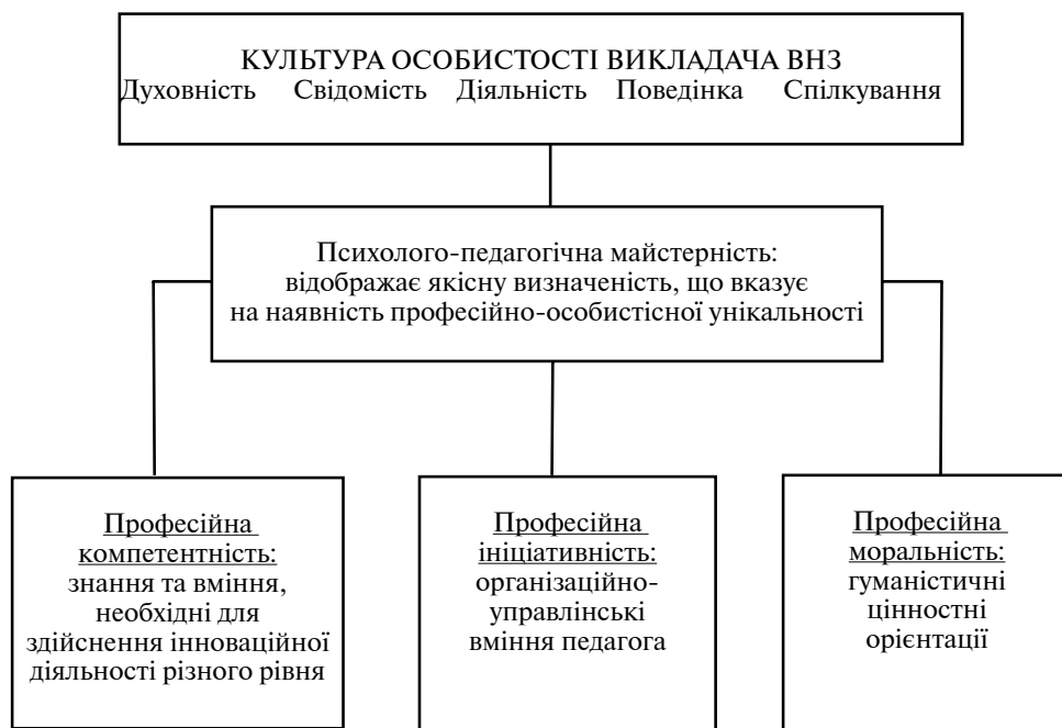
Рис. 2. Структурна схема професіоналізму викладача ВНЗ

Освоєння фахівцем сутнісних характеристик кваліфікації в практичній професійній діяльності зумовлюють становлення нової властивості його особистості — професіоналізму. Спираючись на аналіз літератури, можна дати таке робоче визначення. Професіоналізм являє собою інтегративну властивість особистості педагога, що відображає унікальний для кожного педагога взаємозв'язок і змістовне наповнення компонентів, що входять до складу розглядуваних властивостей — професійної компетентності, моральності, ініціативи і майстерності, що дозволяє кількісно і якісно охарактеризувати неповторну індивідуальність викладача, спираючись на яку можна визначити шляхи підвищення конкурентоздатності викладача на сучасному ринку освітніх послуг. Фактично компетентність, моральність, ініціативність і майстерність знаходяться у відносинах зв'язаності, що діалектично виявляються в ієрархічній субпідпорядкованості. Причин цьому багато, серед яких можна виділити пріоритети (суспільні уявлення), що соціально зумовлюються в сфері професійної діяльності. Найбільш цінні в спектрі професійної діяльності межі (властивості) фахівців визначають домінування тієї або іншої характеристики і відношення взаємозв'язків між ними (рис. 2).